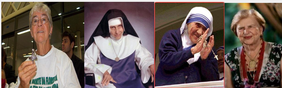
Lideranças femininas na igreja: Dorothy Stang, Irmã Dulce, Madre Teresa, Zilda Arns

Qual o significado da "sucessão apostólica" como base para a ordenação válida de padres por bispos? A análise é da teóloga feminista norte-americana Rosemary Radford Ruether, professora visitante de teologia feminista da Claremont School of Theology e da Claremont Graduate University, nos EUA. Leia mais aqui .