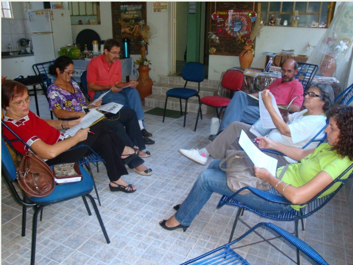
Equipe de organização do videofórum

http://www.centroburnier.com.br/2010/03abr/16_video_forum_religioes_mundo.html